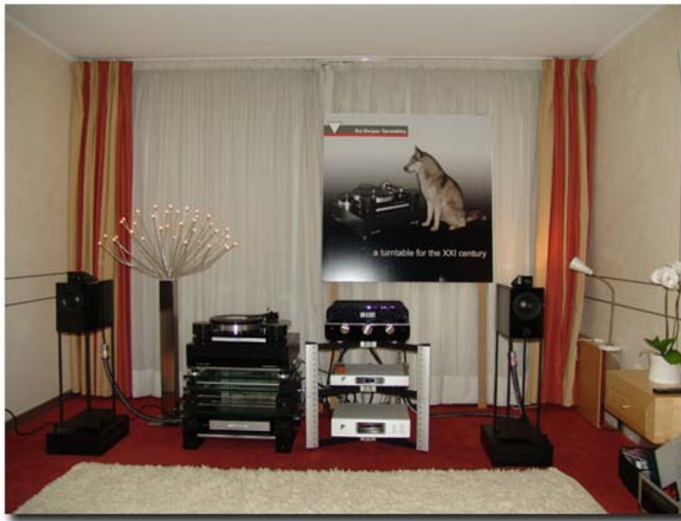
HIFISHOW08_SALA AJASOM/RUI BORGES: QUANDO OS LOBOS (NÃO) UIVAM