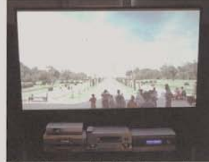
O Barco Cineversum 70 projectou imagem de televisão de alta definição.