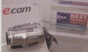
A Panasonic apresentou uma mão-cheia de novidades.