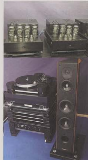
Prima Luna e Sonus Faber para um som com alma.

A Quadratura tinha em demonstração a nova versão do projectador Barco Cineversum 70' com entrada HDMI e o novo Dark Chip 3 , que projectava imagens de alta definição da televisão americana, dando a provar aos presentes um pouco do que será o futuro se e quando a norma for implementada na Europa. Destaque também para os ecrãs LCD da Quali TV , uma marca holandesa que produz televisores LCD de alta resolução, com dimensões que vão das 32" do modelo QD 32HD-05 até às 47" do modelo QD 47HD-05, com uma resolução de nada menos que 1920x1080. É a alta definição em todo o seu esplendor.