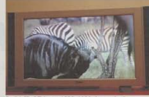
Ecrã LCD QTV com 1920x1080 de resolução.

da série Prestige, que este ano estiveram em grande destaque no Audioshow, Yorkminster nos canais frontais e Sandringham nos restantes, coadjuvadas por subwoofers REL Storm III e Strata V .