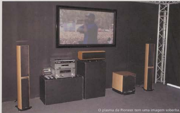
O plasma da Pioneer tem uma imagem soberba.